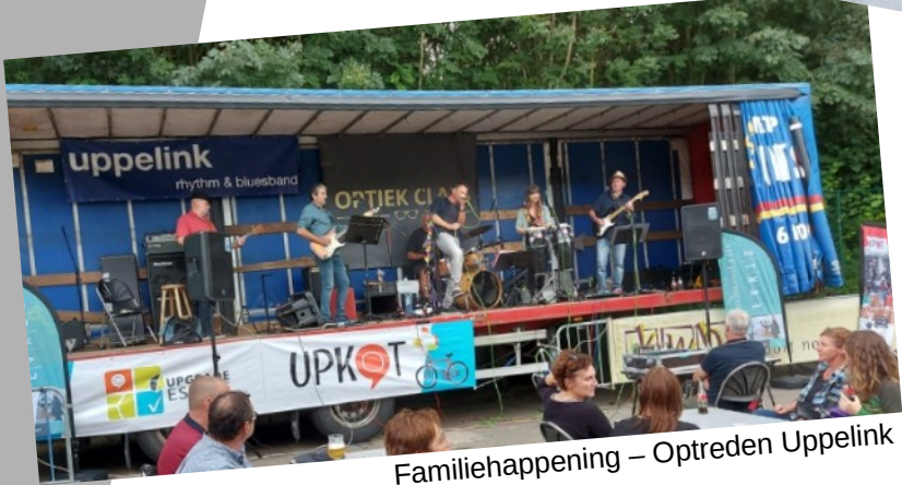
Familiehappening – Optreden Uppelink